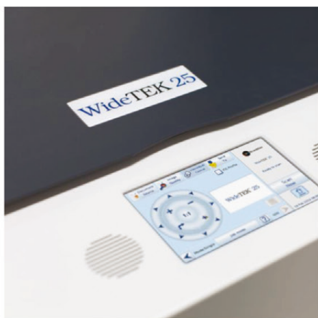
Большой сенсорный экран