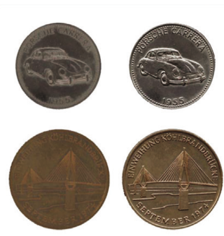
2D-скан по сравнению с 3D